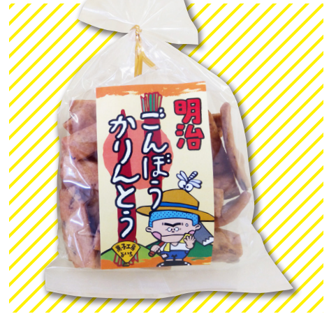
明治ごんぼうかりんとう