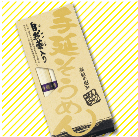
自然薯入りそうめん

母牛が子牛を産んで最初の1週間だけの特別な初乳のうち、出荷可能な6日目のみを使用して製造した無添加プリン。