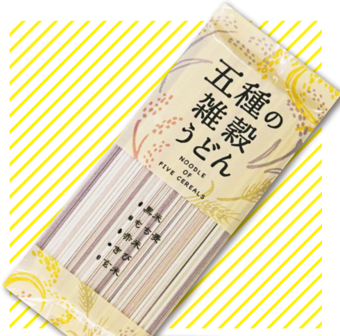
五種の雑穀うどん

瀬戸内海備後灘産の一番摘みの生海苔のみを使用し、海苔本来の味を生かすため薄味でシンプルに炊き上げました。やわらかくとろける口どけと、上品な甘み特徴。