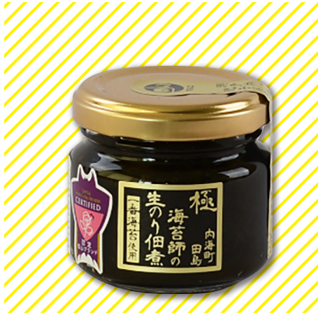
海苔師の生のり佃煮(極)