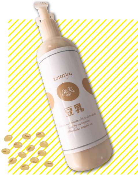
豆乳(プレーンタイプ)