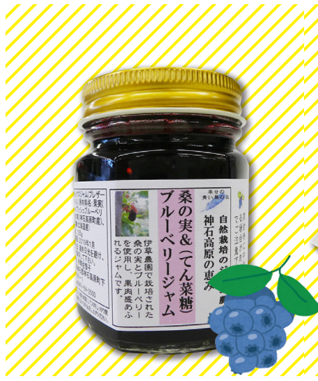
桑の実とブルーベリーのミックスジャム

広島県最大の海苔産地である田島の一番海苔を100%使用し、白トリュフから抽出した成分にひまわり油を加えた白トリュフオイルを使用しています。