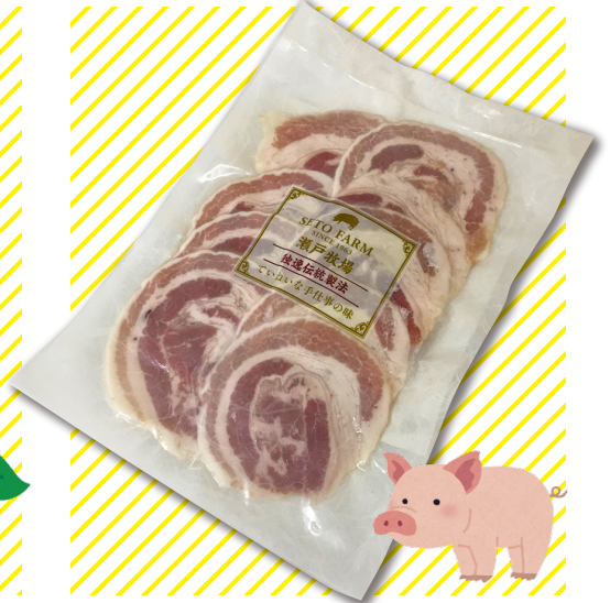
瀬戸のもち豚バラハム

伊草農園で栽培した北部ハイブッシュブルーベリーと桑の実を、北海道産のてん菜糖と丁寧に煮込みました。